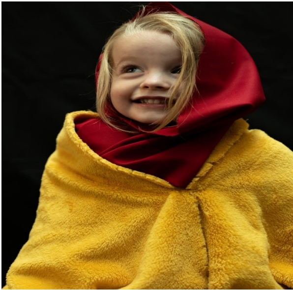
Creëer je middeleeuwse alter ego

Impressie 1 e Publieksdag middeleeuws Amsterdam 30 oktober 2022: