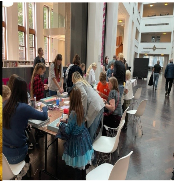
Kinderworkshops in hal van de Bazel