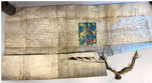
Een fraai charter (in het Latijn)

Dit alles betekent dat het project een prachtige start heeft gemaakt en dat het team klaar is voor de volgende fase: het ordenen, vindbaar en leesbaar maken van alle stukken uit de gasthuisarchieven tot 1578.