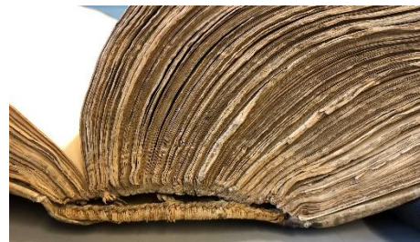
Enorm register dat folio voor folio geanalyseerd wordt